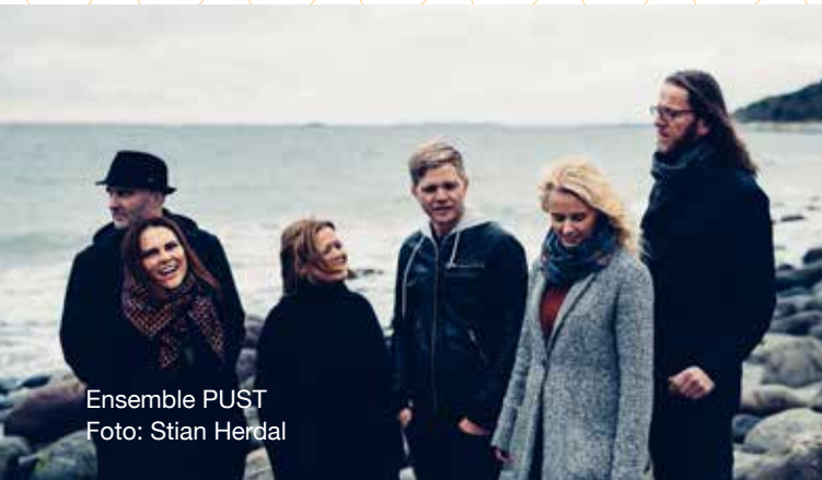
Ensemble PUST

Informationen und Tickets unter: https://pust.org/ https://acappellawoche.reservix.de/p/reservix/event/2024602